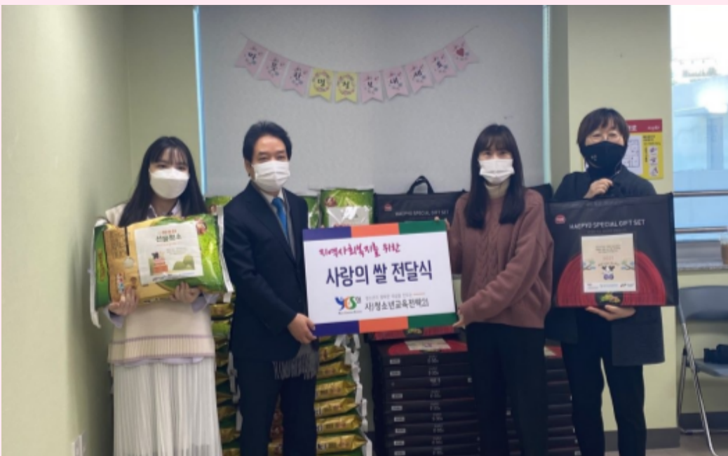
용산구 지역사회 24가구 사랑의 쌀 전달

아울러 지역사회 복지를 위한 사랑의 쌀 전달식을 진행 하였습니다. 이처럼 사)YES21청소년재단은 청소년에게 든든한 힘이 되는 법인으로 함께 나아가겠습니다.