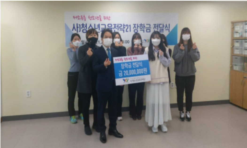
YES장학금 2,000만원 지급

지난 2월 용산구에서 행복한 소식이 있었는데요. 생활 및 학업 여건이 어려운 중에도 인성과 품행이 타의 모범이 되는 청소년 23명에게 생활지원 YES 장학금을 지급하였습니다.